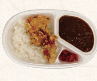
カレーライス&からあげ