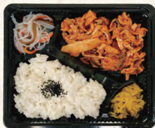
豚キムチ炒め弁当