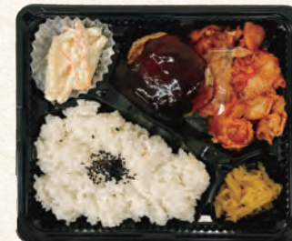
豚キムチ&ハンバーグ弁当