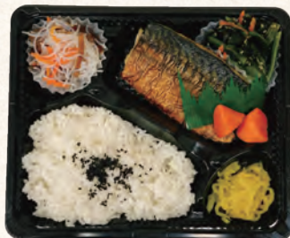
さばの塩焼き弁当