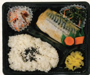
さばの味噌煮弁当