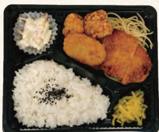
ロースカツ&コロから弁当