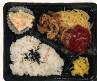
焼肉&ハンバーグ弁当