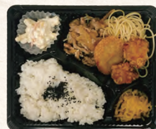
豚生姜焼き&コロから弁当