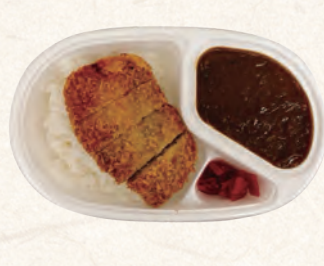
ロースカツカレー