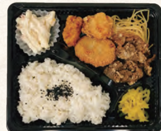
焼肉&コロから弁当