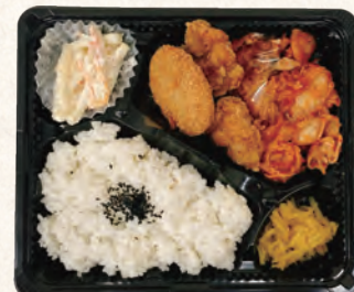
豚キムチ&コロから弁当