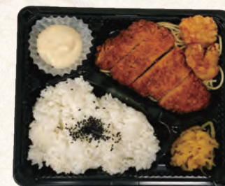
チキン南蛮&からあげ弁当