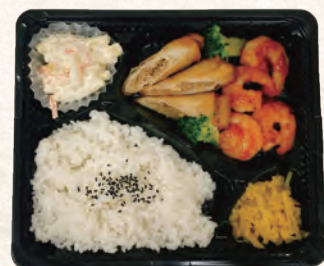
海老チリと春巻きの中巻弁当