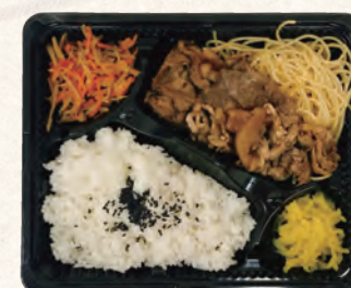
牛カルビ焼肉弁当