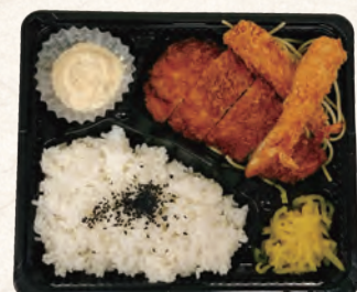
チキン南蛮&エビフライ弁当