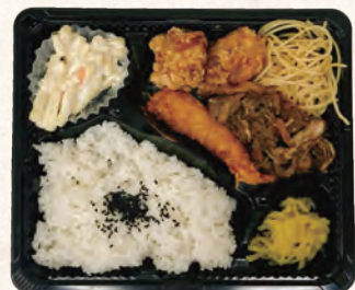
焼肉&えびから弁当