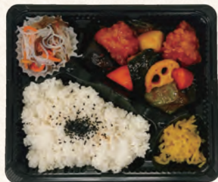
鶏と野菜の甘酢あん弁当