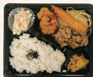
豚生姜焼き&えびから弁当