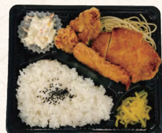
ロースカツ&えびから弁当