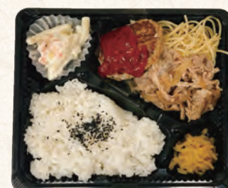
豚生姜焼き&ハンバーグ弁当