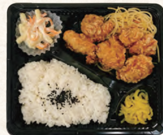
鶏もも唐揚げ弁当