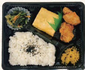
出汁巻き玉子弁当