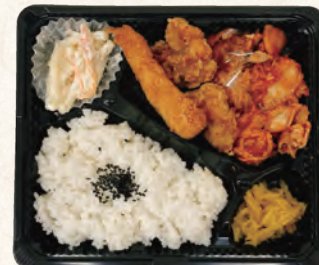
豚キムチ&えびから弁当